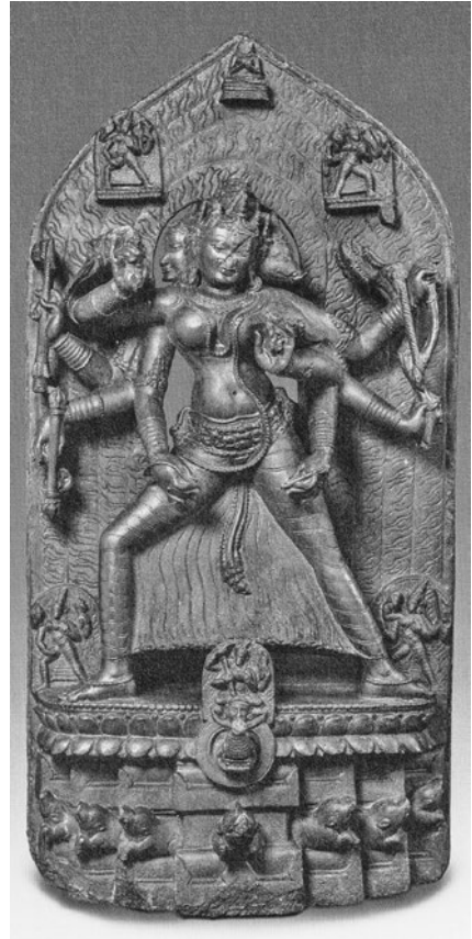
図3. 三面八臂のマーリーチー像 11世紀(パラ朝)インド・ビハール州

他方、8C前半頃にインド仏教中観派の僧侶シャーンティデーヴァ Śāntideva が著したといわれる Śikṣāsamuccaya 『学処集成』 42 には、盗賊から身を守るための呪文としてマーリー