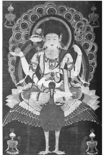
図1. 孔雀明王像 平安時代後期(12C) 国宝

五護陀羅尼のうち、『孔雀経』は初期密教経典の中でも最初期に成立した経典とされる。日本には空海によって請来され、鎮護国家の大法の一つとして古くから重要な密教経典の一つに位置づけられた。本論文で取り上げる女尊 Mahāmāyūrī (以下、マハーマーユリーと称す)は、この『孔雀経』にもあらわれる孔雀の持つ特性が神格化された女神と言われている(図1. 参照 2 )。なお、五護陀羅尼には現在2種の構成